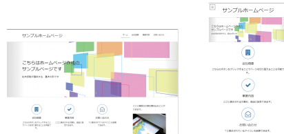
レスポンシブデザイン